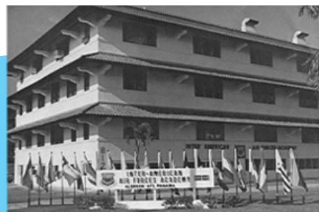
Albrook AS, Panama 1943-1989