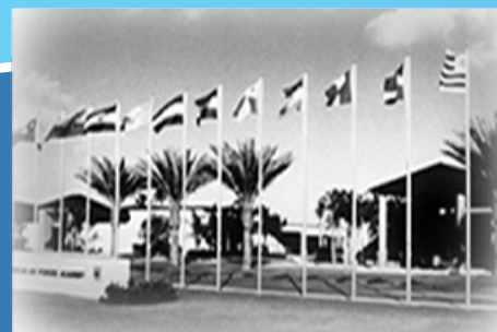
Homestead AFB, FL 1990-1992