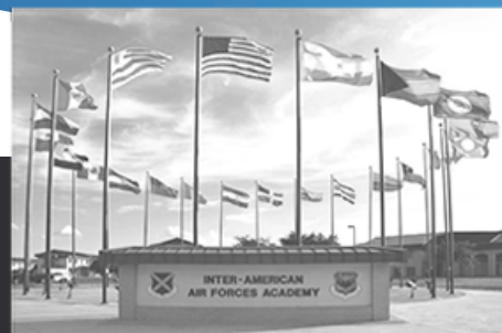
JBSA-Lackland, TX 1993-Presente